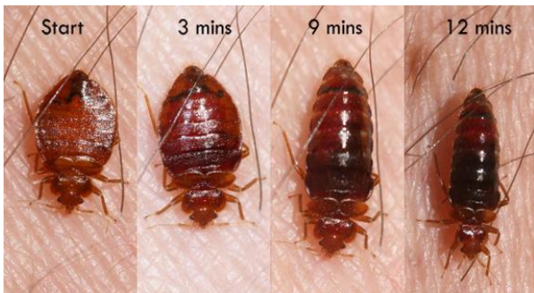
مراحل خونخواری ساس

ساس‌های تختخواب ناقلین مهمی در انتقال بیماری نیستند. این حشره به دلیل گزش دردناک برای انسان آزاردهنده است. برخی از مردم به ویژه افرادی که به مدت طولانی در معرض تغذیه این حشرات بوده‌اند، در برابر گزش آن‌ها واکنش کمتری نشان می‌دهند، یا حتی هیچ‌گونه واکنشی از خود نشان نمی‌دهد. افرادی که در گذشته در معرض ساس نبوده‌اند ممکن است از التهاب موضعی، خارش شدید و بی‌خوابی در شب صدمه ببینند.