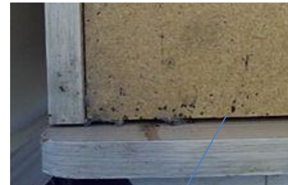
لکه ی ناشی از وجود ساس در گوشه تخت