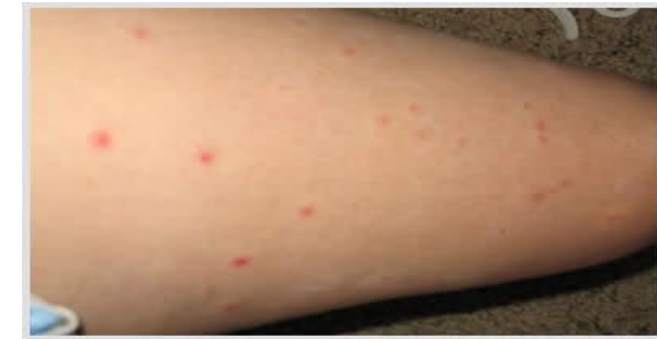
علائم گزش ساس

می توان آلودگی این حشره را از طریق بررسی مخفیگاه-های احتمالی جهت مشاهده ی ساس های زنده، پوسته رها شده ی نمف، تخم و مدفوع مشخص کرد. مدفوع حشره ممکن است به صورت لکه های کوچک سیاه یا قهوه ای تیره روی ملافه ها، دیوارها و کاغذ دیواری قابل مشاهده شوند. خانه هایی که آلودگی شدید به این حشرات را دارند ممکن است بوی ناخوشایندی نیز داشته باشند.